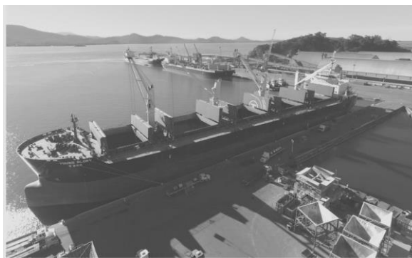
PORTO DE SÃO FRANCISCO DO SUL FECHA O ANO DE 2017 COM MOVIMENTAÇÃO POSITIVA

Se comparado ao ano anterior, crescimento foi de 17%!