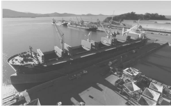
PORTO DE SÃO FRANCISCO DO SUL FECHA O ANO DE 2017 COM MOVIMENTAÇÃO POSITIVA

===== 12) Notícia veiculada sobre Porto de São Francisco do Sul informa crescimento nas movimentações: