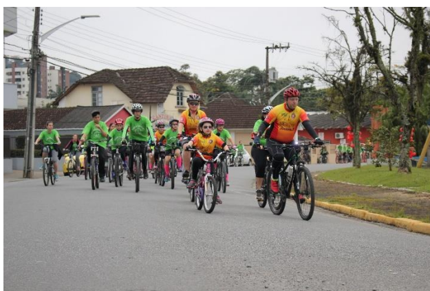
Figura 13 – trajeto pedal