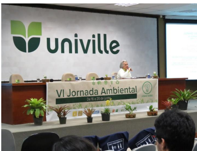
Figura 04 – palestra de abertura