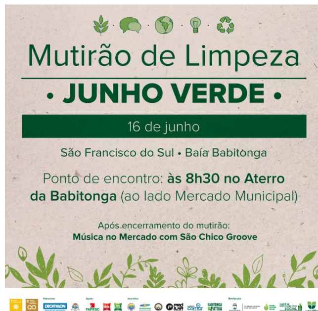
Figura 05 – mídia do mutirão de limpeza na Babitonga