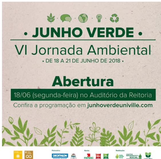
Figura 01 – mídia de abertura Junho Verde e VI Jornada Ambiental