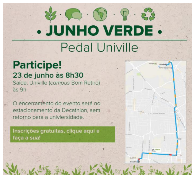
Figura 11 – mídia pedal