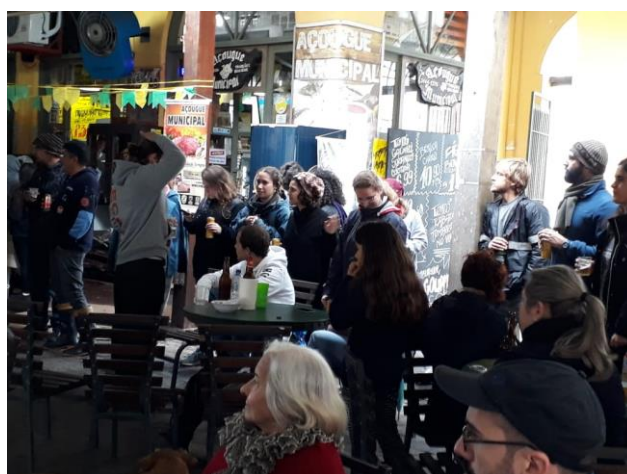
Figura 09 – público da música no mercado