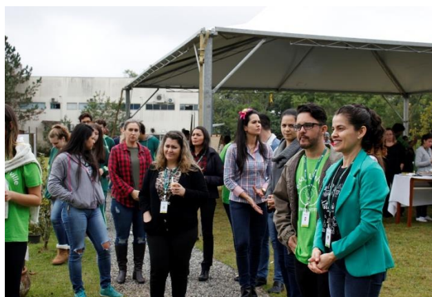
Figura 17 – encerramento Junho Verde