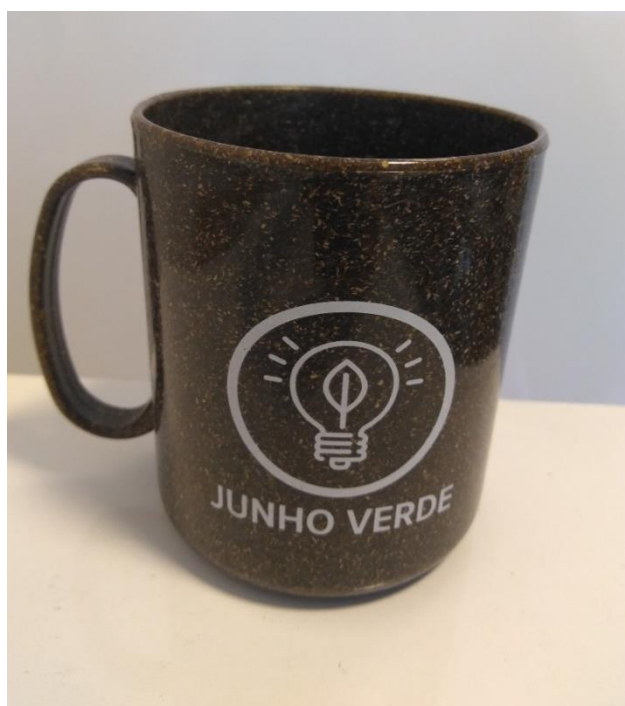
Figura 15 – detalhe das canecas distribuídas