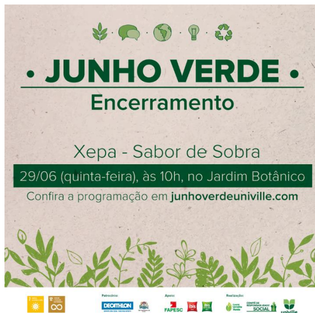
Figura 16 – mídia encerramento