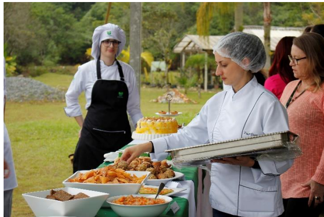
Figura 26 – coquetel elaborado com a xepa