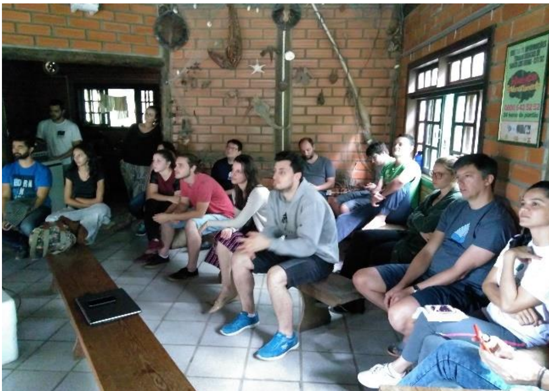
Figura 30 - Apresentação resultados do curso de Ecologia – UFSC