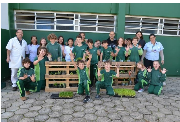
Figura 23 – oficina horta vertical em São Bento do Sul