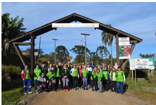
Figura 19 – caminhada em São Bento do Sul