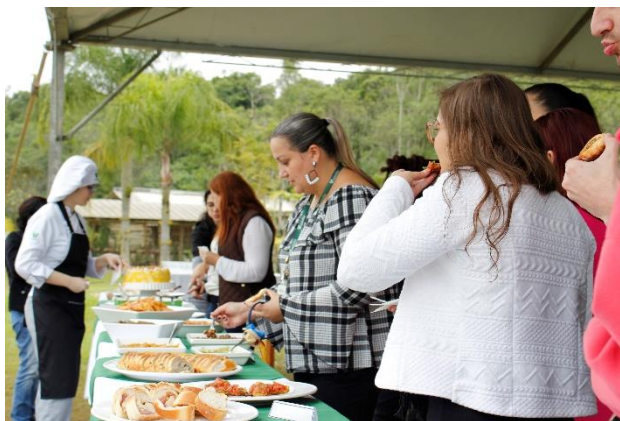
Figura 27 – participação de funcionários, alunos e professores