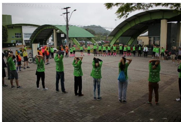
Figura 12 – concentração pedal