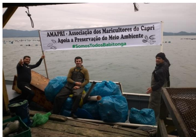
Figura 07 – associações participantes do mutirão de limpeza