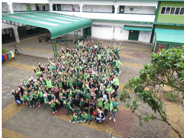
Figura 24 - Foto Junho Verde do colégio Univille Joinville