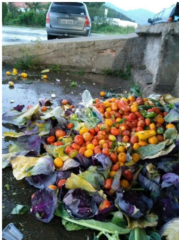
Figura 18 – material coletado no CEASA para a XEPA