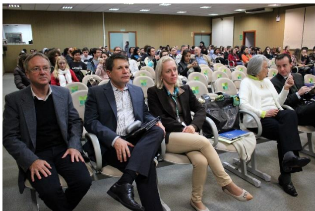
Figura 02 – público presente na abertura