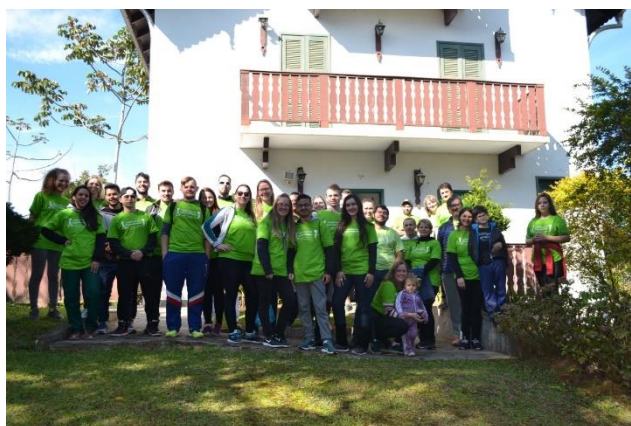
Figura 21 - Chegada no CEPA RUGENDAS – SBS