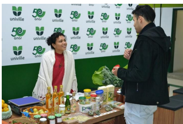
Figura 22 – feira de orgânicos em São Bento do Sul