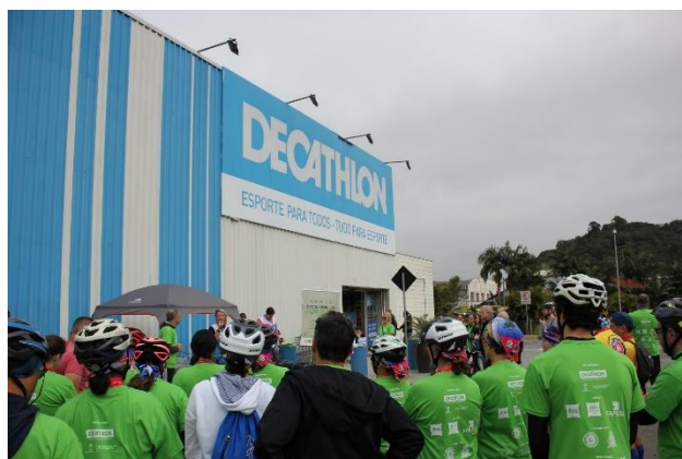
Figura 14 – chegada do pedal Decathlon