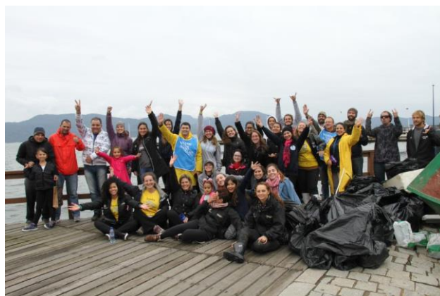
Figura 06 – participantes do mutirão de limpeza