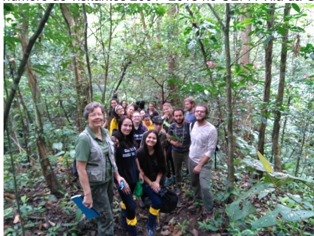
Figura 29 – Aula de campo biologia - UNIVILLE