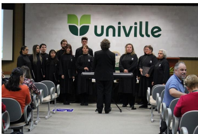
Figura 3 – apresentação do Coral Univille