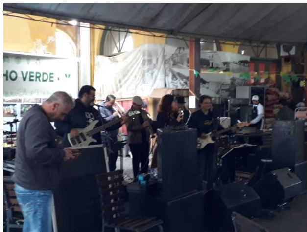
Figura 08 – música no mercado